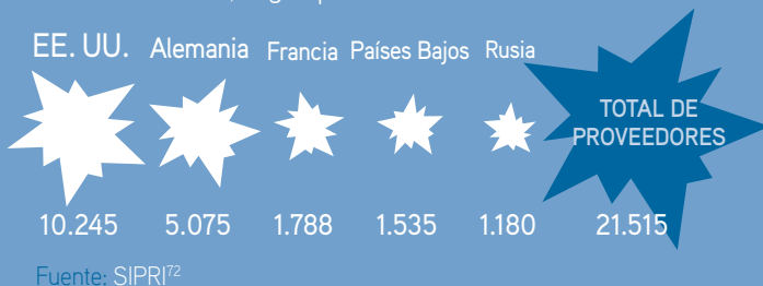
Gráfico 2 Principales proveedores de armas de Grecia 1990-2011 - Datos del TIV del SIPRI, 71 en millones de dólares, según precios constantes de 1990

recordando una reunión entre líderes sindicales con la canciller alemana Angela Merkel: