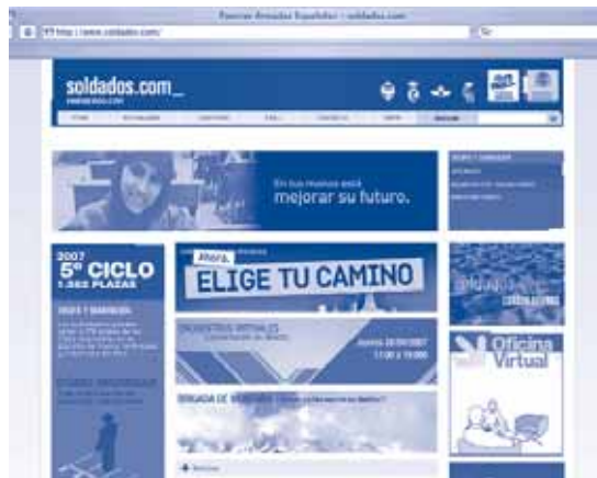
Pàgina d'internet de les Forces Armades promovent la imatge de l'exèrcit

Aquesta intervenció marca una esclatxa en la percepció de la seguretat que tenim les persones i els militars i que fa necessari obrir un debat social i parlamentari. Segons el tinent general Pedro Bernal, les amenaces a la seguretat d'Espanya són: el terrorisme, el crim organitzat, les epidèmies, les armes de destrucció massiva, els desastres ecològics o els accidents a gran escala. Si deixem de pensar en conceptes abstractes com la seguretat d'Espanya i ens preguntem quins són aquells