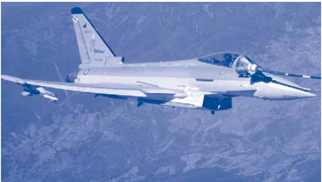
Un Eurofighter durant un abastament de combustible en l'aire

indústria de defensa que va arribar a acusar en diferents ocasions els ministres de defensa dels estats membres de falta de confiança en la gestió de l'AED per no concedir-li un pressupost molt més gran (bàsicament es plantejava passar dels 20 milions d'euros als 200) per gestionar programes d'I+D de defensa davant els reptes de seguretat que havia d'afrontar la UE. Com a conseqüència d'aquesta pressió, finalment s'ha establert un model de col·laboració i de finançament voluntari de programes conjunts que tendirà a augmentar en quantia any rere any.