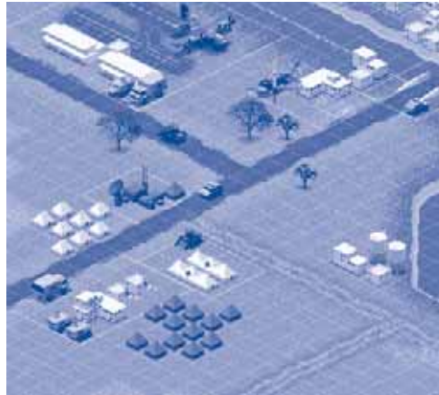
Joc amb el nom: "Missió de pau" a la pàgina www.soldados.com del Ministeri de Defensa

Es reconeix el dret a no prestar servei a les forces armades o altres organitzacions que requereixin l'ús de les armes i, eliminant un dels aspectes més contestats de la Llei del 84, exclou l'obligatorietat de l'objector de relatar i justificar les seves creences. Però es manté el dret de l'Estat a mobilitzar els objectors en organitzacions que no requereixin utilitzar les armes, però que poden estar igualment implicades en l'esforç de guerra. D'aquesta manera l'objecció de consciència queda limitada a un dret a no «tocar les armes», a no estar enquadrat en una organització militar, però no a objectar la guerra o el conflicte.