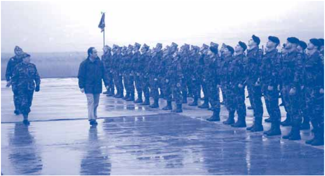
Tropes espanyoles del destacament de la UE en Mòstar (Bòsnia) al desembre de 2004

reconstrucció és canalitzada a través de les forces armades. La qual cosa contravé els acords del dret internacional humanitari que disposen de tres regles precises sobre aquest punt: neutralitat, imparcialitat i independència. Unes regles que es trenquen en el cas de les forces armades, ja que ni són imparcials i ni de bon tros neutrals ni independents.