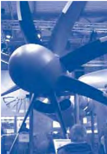
Motor del Airbus A400M.

Si busca una nova ocupació, el Sr. Maragall en comptes de donar suport a la indústria de defensa podria fer com els expresidents Oscar Arias o Jimmy Carter que, a través de les seves fundacions, promouen solucions pacífiques per resoldre els conflictes del planeta.