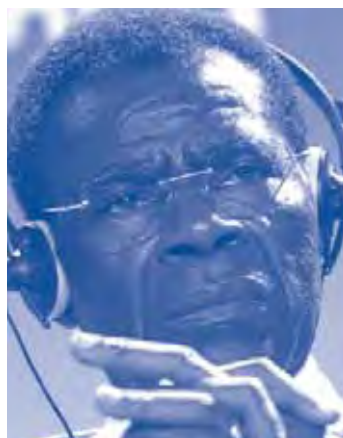
Teodoro Obiang

1979, va fer una visita oficial a l'Estat espanyol, sense que les autoritats espanyoles fessin cas de la denúncia realitzada per l'oposició democràtica guineana a la dictadura d'Obiang. Durant els primers dies de novembre, l'Associació de Solidaritat