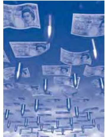
Il·lustració sobre la BAE a www.angloarabia.com

Segons els demandants, la suspensió de les investigacions suposa una violació de la Convenció contra la Corrupció de l'Organització per a la