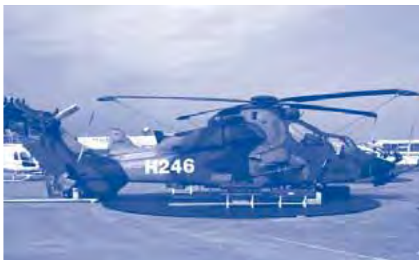
Més de 60 milions d'euros del pressupost seran per a helicòpters Tigre.

L'anàlisi que realitzem cada any s'ajusta al criteri d'incloure aquelles partides militars que es troben repartides per altres ministeris, com són: les classes passives militars, els militars que han passat a la reserva o són pensionistes; les quotes socials dels militars de l'Institut Social de les Forces Armades; la R+D militar que es comptabilitza en el Ministeri d'Indústria; la contribució a l'OTAN del Ministeri d'Exteriors; el cos paramilitar de la Guàrdia Civil, a càrrec del Ministeri de l'Interior. Aquestes partides, la mateixa Aliança Atlàntica les assumeix com a militars i recomana la seva inclusió com a despesa de les forces armades. Nosaltres, a més, afegim la part proporcional dels interessos de l'endeutament de l'estat en Defensa. Això no tindria justificació per la despesa ordinària de manteniment dels exèrcits, però sí que la té, com després veurem, a causa de l'alt percentatge dedicat a les inversions militars. Que la despesa militar sigui molt superior a la del Ministeri de Defensa és una pràctica comuna a la majoria dels estats. Els mateixos Estats Units no inclouen les despeses de les seves forces militars a l'Iraq i a l'exterior en el pressupost del Pentàgon. És per aquest motiu que tant l'OTAN com el SIPRI d'Estocolm, un dels instituts d'investigació per a la pau de més prestigi, aconsellen la inclusió de les despeses militars repartides per altres ministeris en la despesa militar total.