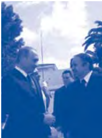
Putin i Bouteflika el 10 de març de 2006.

Rússia i França superen per primera vegada els EUA en la venda d'armes a Algèria. Aquesta notícia no és cap anècdota aïllada. El 2005, la indústria russa d'armament va superar els Estats Units en la venda d'armaments als països en vies de