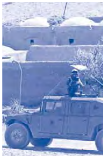
Soldat espanyol a Afganistán

estat la de combatre els maltractaments, la violència, les agressions sexuals o els atemptats als drets fonamentals de tropa i militars, sinó combatre'n la indisciplina, i això