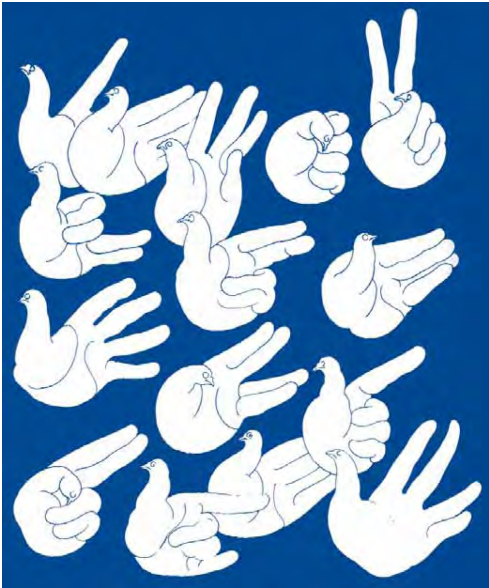
Milton Glaser. Peace Works. 1972