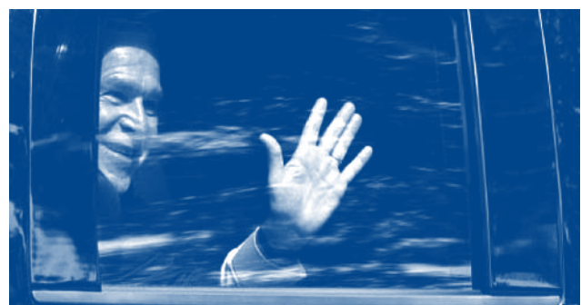
George W. Bush en el cotxe presidencial ·

A partir d'ara la ciutadania de Catalunya (i la del País Valencià, Castilla La Mancha, Euskadi, Aragó, Canàries, i les Illes Balears) quan dugui el seu cotxe a revisar a una estació de la ITV, ha de saber que està lliurant dividends a les famílies Bin Laden, Bush i altres coneguts benefactors de les guerres preventives portades a terme a l'Afganistan i a l'Iraq.