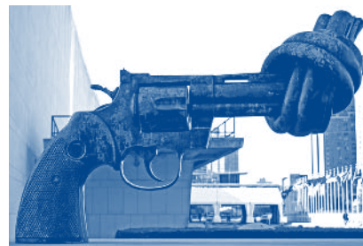
Escultura de Fredrik Reutersward en la sede de la ONU en Nueva York.

La notícia suposa una important victòria dels moviments contra el comerç d'armament, i una inspiració per altres grups de tot el món que actuen per aturar aquests macabres esdeveniments.