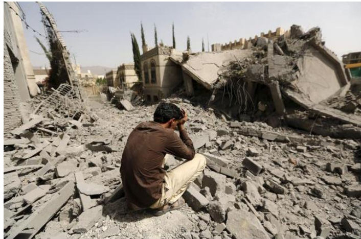
Edificios destruidos como consecuencia de los bombardeos de la coalición en la ciudad de Sana

Al Iemen els bombardejos de la coalició liderada per l'Aràbia Saudita estan empitjorant la terrible situació humanitària generada com a conseqüència del conflicte armat. Més de 32.000 persones han perdut la vida o estan ferides des de l'inici de la coalició al març de 2015, havent provocat també més d'un milió de desplaçats. Segons dades de desembre de 2015 de l'OCHA ( Office for the Coordination of Humanitarian Affairs ) com a mínim el 80% de la població requereix algun tipus de protecció humanitària. 6